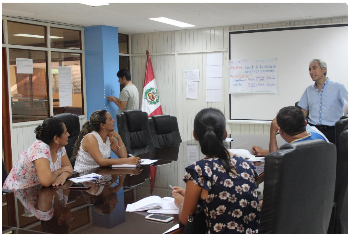
Figura 1. Participantes elaborando OEI y AEI del PEI de la MPCM 2019-2022. Coronel Portillo 31.5.2018.