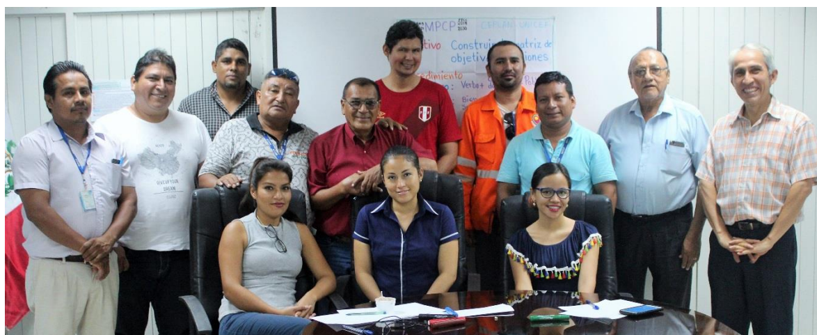
Figura 4. Participantes de la reunión de elaboración del PEI de la MPCP 2019-2022. Coronel Portillo 1.6.2018.