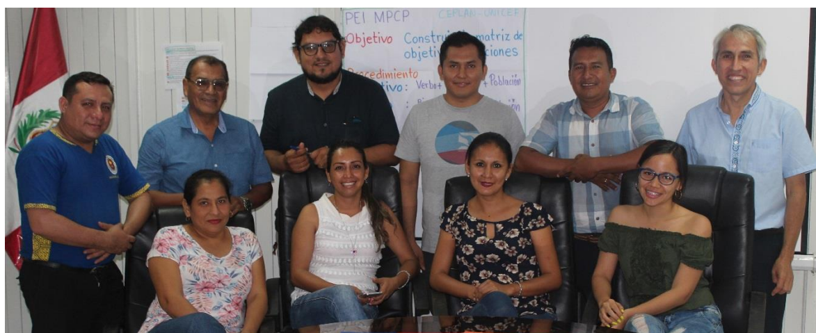
Figura 2. Participantes de la reunión de elaboración del PEI de la MPCM 2019-2022. Coronel Portillo 31.5.2018.